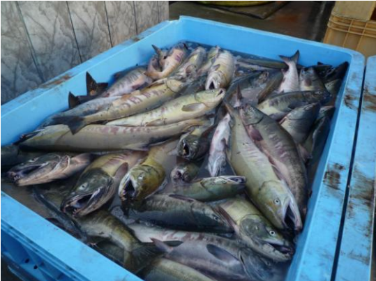
長万部(おしゃまんべ)

長万部で獲れた鮭の頭から、特殊技術で鼻軟骨だけを取り出し、工場で成分が変性しないように丁寧に抽出されております。